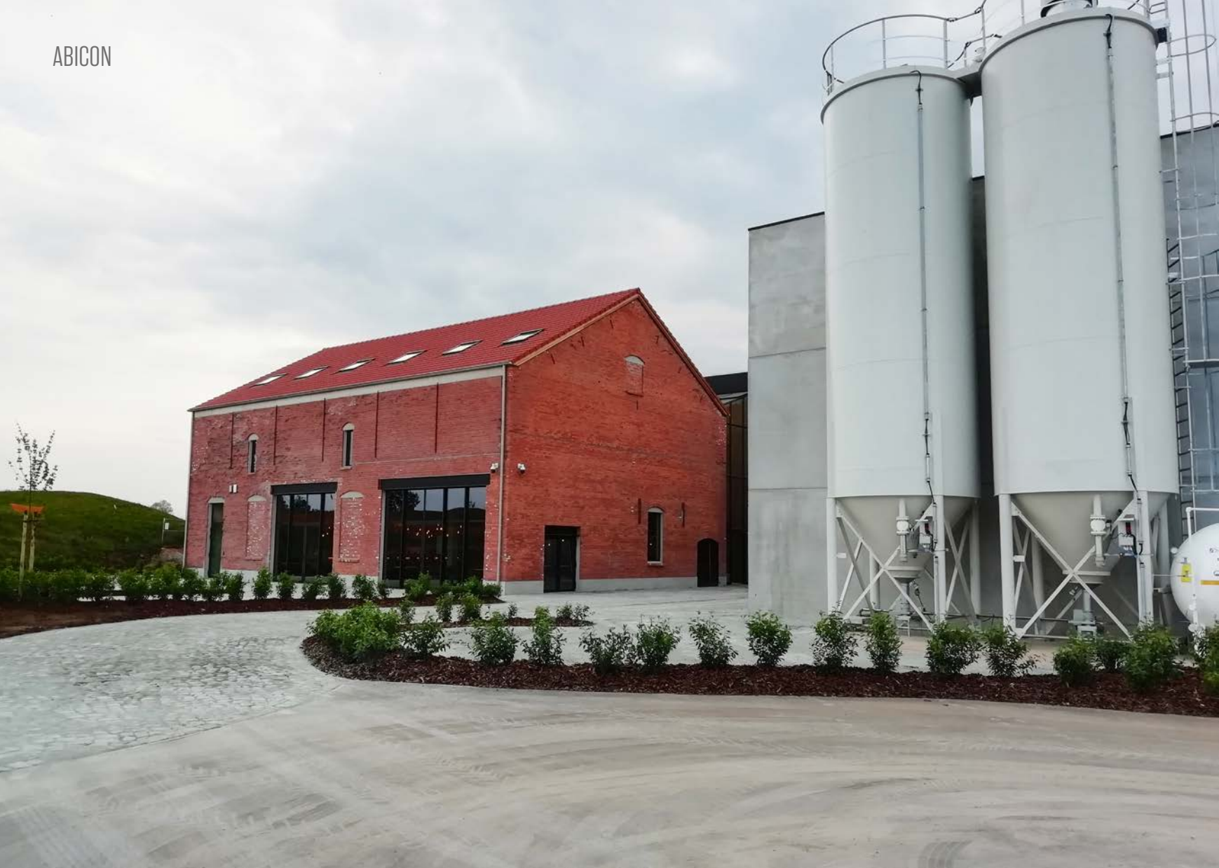
Het brouwerijcomplex van The Musketeers in Sint-Gillis-Waas.